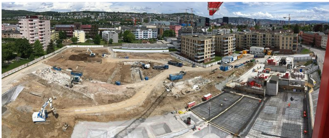
Beginn Bauphase Etappe 2