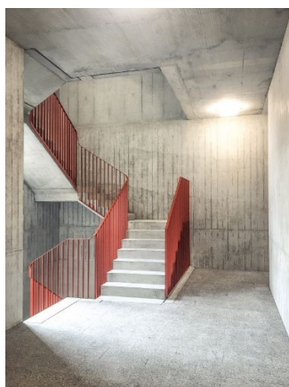
Treppenhaus in Sichtbeton