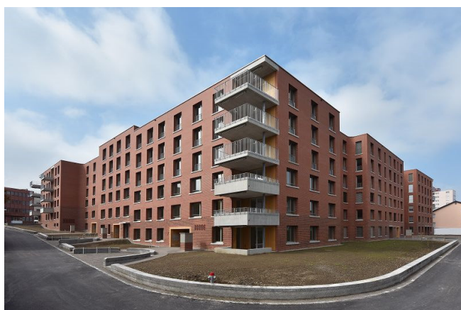
Ansicht Ringstrasse – Ende Etappe 1