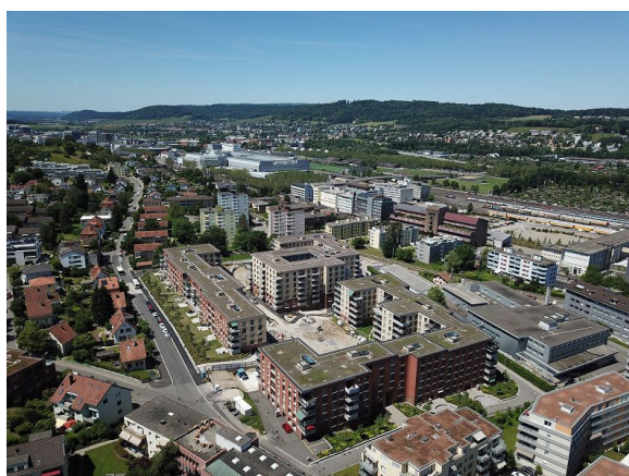
Luftaufnahme der Siedlung