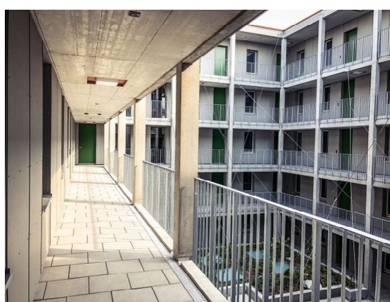
Innenhof mit Laubengang